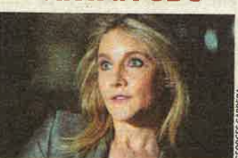
La conseillère nationale UDC genevoise, Céline Amaudruz, a été élue, hier, à la vice-présidence