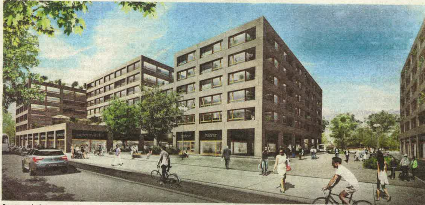
Au cœur du futur quartier: une grande place s'ouvrant sur un grand mail traversant tout le périmètre.

Les Communaux d'Ambilly font partie des trois grands projets de logements initiés il y a une douzaine d'années. Les Vergers à Meyrin et La Chapelle à Lancy sont en cours de construction. Le projet des Communaux a, lui, connu davantage de déboires. Le Canton a